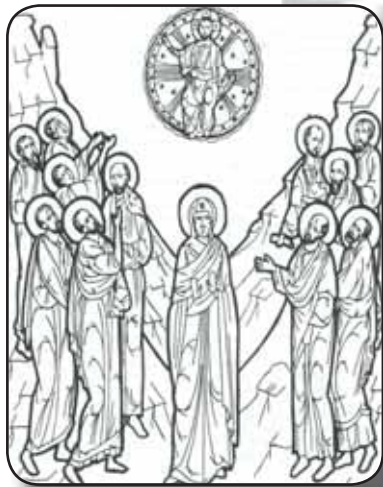
Свети Владика Николај

Хвалимо и ми и благосиљајмо Господа, који нам је вазнесењем Својим отворио ум, да видимо пут и циљ нашега живота. Хвалимо и благосиљајмо Оца, који на нашу љубав према Сину одговара Својом љубављу, и усељава се заједно са Сином, у сваког оног који држи и исповеда заповести Господње. И држимо у уму нашем непрестано Оца и Сина, хвалећи их и благосиљајући - као апостоли негде у граду јерусалимском - чекајући, да и на нас сиђе сила с висине, Дух Утешитељ, који још при крштењу на сваког од нас силази, но који се због греха наших од нас удаљава. Да би се и у нама тако обновио цео првобитни небесни човек. Да би се тако и ми, као апостоли, удостојили, да нас благослови прослављени и вазнесени Господ наш Исус Христос, коме нека је слава и хвала, са Оцем и Духом Светим - Тројици једносушној и неразделивој, сада и увек и у векове векова. Амин.